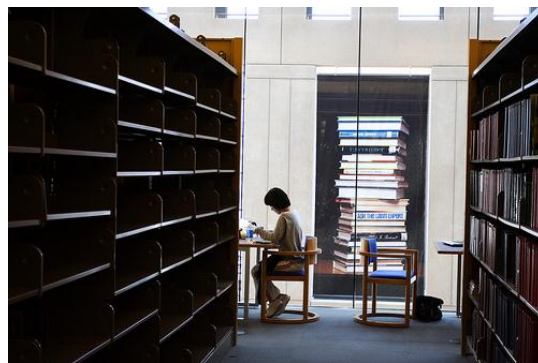
(上图为大会指定参观的Gabrielle-Roy Library)

通过参与本次会议，中国代表了解到了全球图书馆学和图书馆事业发展的前沿动态，学习了国外代表的先进经验和理念，有利于我国图书馆事业的发展 and 进步。